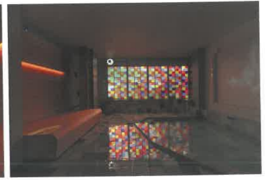
パステルカラーのタイルを貼った大浴場「明湯」。窓にはスタンドグラスをあしらった。利用は無料。泉質はナトリウム・カルシウム-塩化物・硫酸塩温泉。