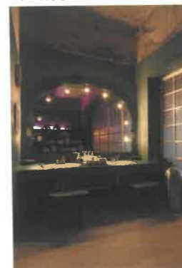
脱衣場。鏡はハリウッドミラー風に仕立てた。