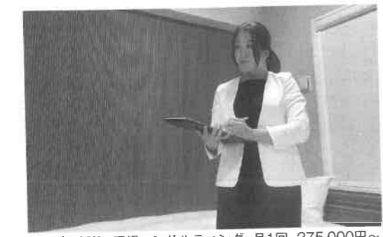
サービス価格 現場コンサルティング 月1回 275,000円〜

「あるホテルオーナー様から、外部清掃会社の清掃に不備が多く、改善が見込めないうえに、宿泊予約サイトでの評価も低い」と相談がありました。そこで、作成したチェックリストをもとに清掃品質を管理し、ルームインスペクター制度を導 「あるホテルオーナー様から、外部清掃会社の清掃に不備が多く、改善が見込めないうえに、宿泊予約サイトでの評価も低い」と相談がありました。そこで、作成したチェックリストをもとに清掃品質を管理し、ルームインスペクター制度を導