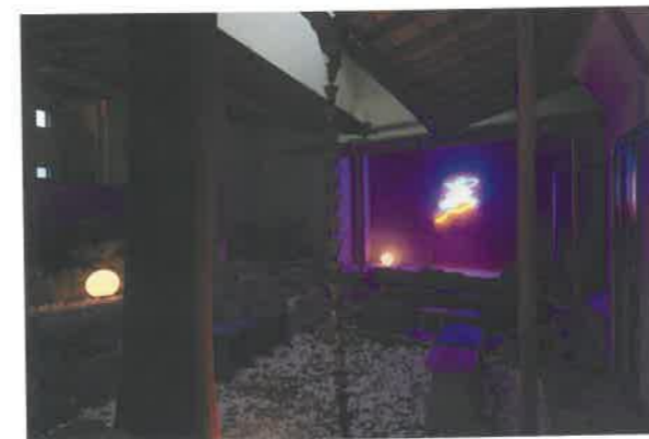
椅子を配した中庭には、館名にちなんで「夢」のネオンサインを飾っている。