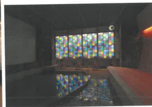
大浴場「暗湯」。明湯とともに檜のベンチを新設し、夢をテーマにしたインスタレーション映像の投影を行なう。カランはすべて金メッキ調に刷新した。