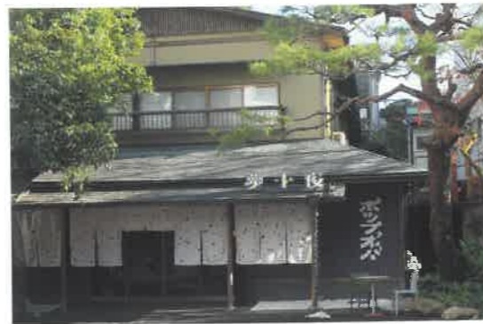
JR湯河原駅より車で約10分。奥湯河原エリアに建つ90年以上の歴史を有する温泉旅館をリノベーションした。エントランスにはポップなデザインの暖簾を飾る。